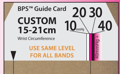
▲ Fig. A Juist afgesteld voor 20-30mmHg

CircAid Medical Products, Inc. is niet aansprakelijk voor letsel of schade voortvloeiend uit verkeerd (contra-geïndiceerd) gebruik van haar producten. CircAid is een geregistreerd handelsmerk en BPS, Built-In Pressure System, en Juxta-Fit zijn handelsmerken van CircAid Medical Products, Inc. ©2012 CircAid Medical Products, Inc. Alle rechten voorbehouden.