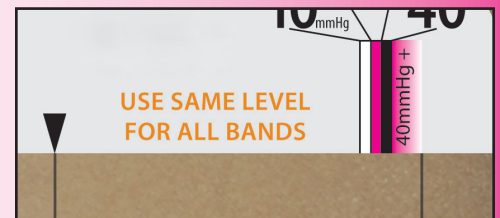
▲ Fig. C For meget spænding til 20-30mmHg. Indstillet til 40mmHg+