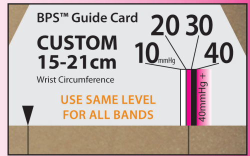
▲ Fig. A Korrekt indstillet til 20-30mmHg

CircAid Medical Products, Inc. tager ikke ansvar for skader pådraget under ukorrekt brug af det produkter. CircAid er et registreret varemærke og BPS, Built-In Pressure System, og Juxta-Fit er varemærker under CircAid Medical Products, Inc. ©2012 CircAid Medical Products, Inc. Alle rettigheder forbeholdt.