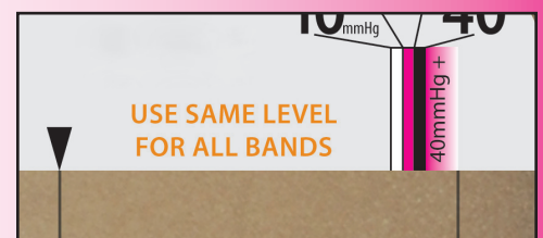
▲ Fig. C Te veel spanning voor 20-30mmHg, Stel af naar 40mmHg+