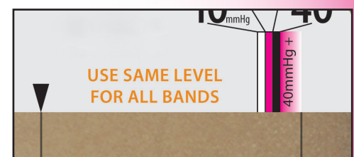
▲ Fig. C Too much tension for 20-30mmHg, Set to 40mmHg+