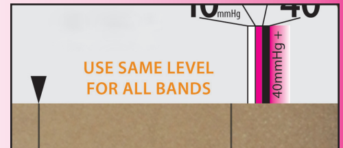
▲ Fig. B Ikke nok spænding til 20-30mmHg