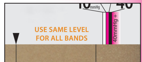
▲ Fig. B Not enough tension for 20-30mmHg